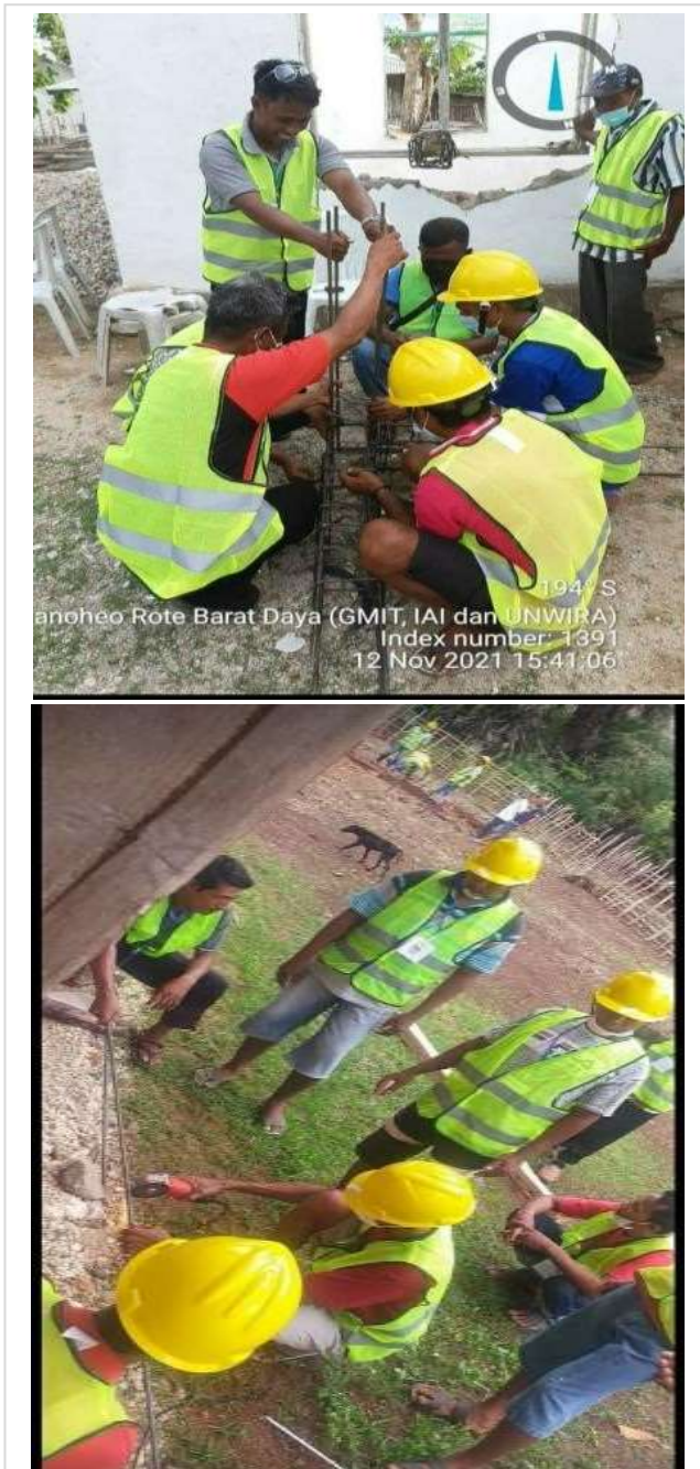
Gambar 5. Suasana saat melakukan pemaparan materi pelatihan