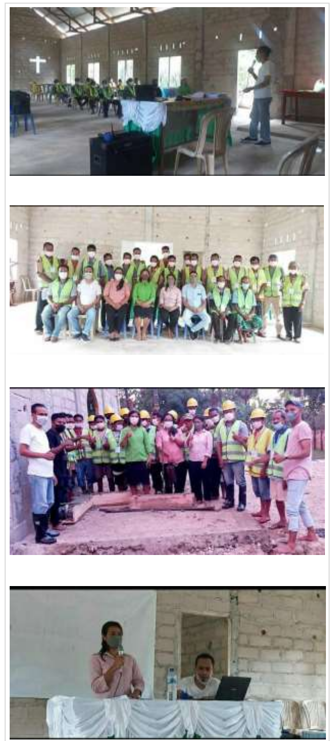
Gambar 4. Suasana saat melakukan pemaparan materi pelatihan