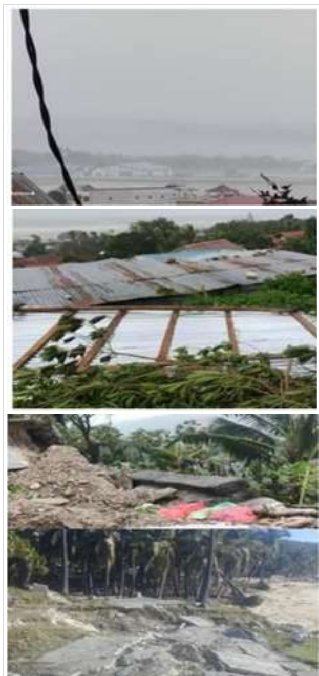
Gambar 1. Kerusakan pada bangunan akibat badai seroja

terputus, irigasi, pepohonan. Salah satunya ialah yang menimpa Gereja GMIT Eklesia Mokdela Desa Daurendale, Kecamatan Landuleko. Walaupun terdapat banyak tenaga tukang bangunan yang dapat membangun Gedung bangunan yang besar tetapi dalam kenyataannya para tukang bangunan ini belum memahami konsep pembuatan bangunan yang kuat secara struktur, terhadap gempa dan angin kencang (Hartono, Diana, and Muhyidin 2021).